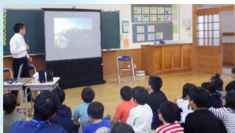
最後は三光の工場を映像でご紹介！

久々の出前授業ということもあり少し緊張しておりましたが、みなさんのお陰でとても楽しい時間を過ごすことができました。また、保護者の方、先生方におかれましては、準備等ご協力頂きありがとうございました。