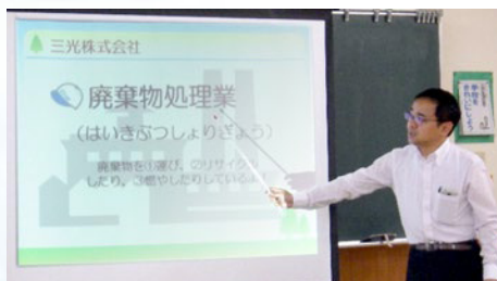
三光は「廃棄物処理」…ごみを運んだりリサイクルしている会社です。