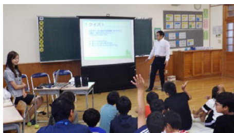
クイズを交えて学びました。