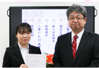
三輪社長から辞令を交付されたみなさん