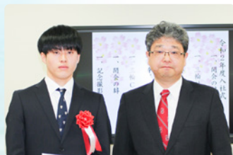
三輪社長から辞令を交付されたみなさん