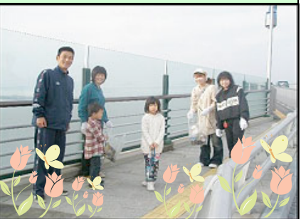
ハイポーズでなくゴミ拾い、違うか!