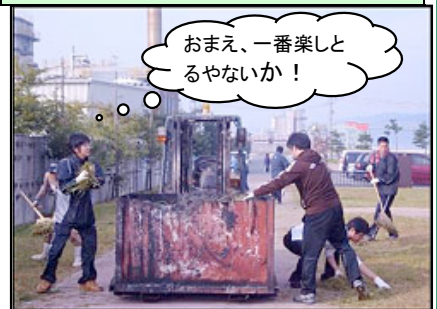
おまえ、一番楽しんでるやないか!