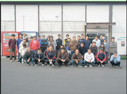
我ら江島大橋組だ、文句あつか!