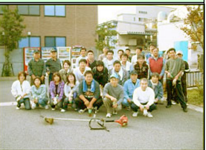
1時間で完結し満足げな北緑地組!