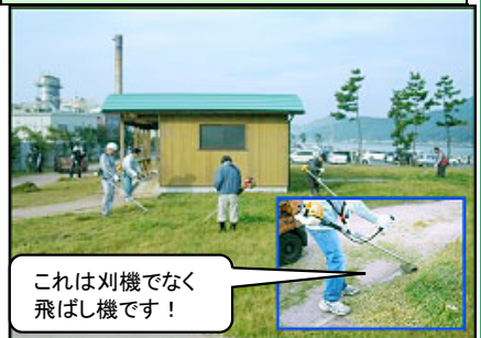
これは刈機でなく飛ばし機です!