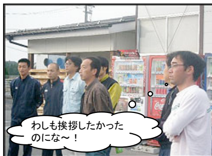
わしも挨拶したかったのにな～!