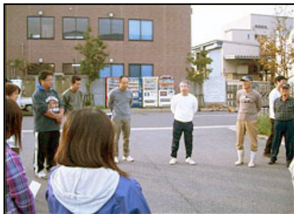
挨拶される明穂部長、隣は社長です

秋の三光(株)環境ボランティアとして、10月25日(日)に総勢65名の参加で心地の良い汗をかきました。今回は多少参加者が少なかった為、境水道大橋は中止とし昭和北緑地と江島大橋チームに分かれて草刈やゴミ拾いなどを実施しました。春は雨の影響で順延順延となりましたが、当日は曇空で雨にたたられる事なく、無事秋の清掃ボランティアを終了しました。今回は特に昭和北緑地での手際の良さが目立ちました、草刈道具の準備と事前の部門間打合せが功を奏しています。