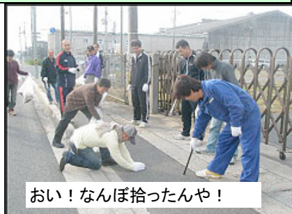
おい! なんぼ拾ったんや!