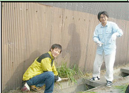
工場の壁際草取も何故かカメラ目線?