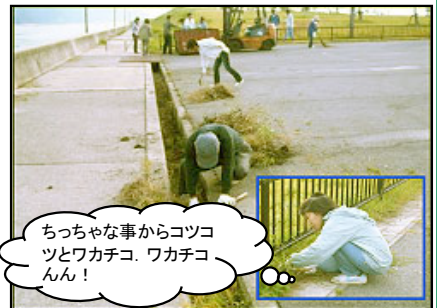
ちっちゃな事からコツコツとワカチコ、ワカチコん!