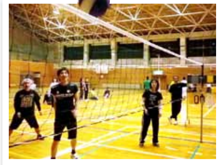
ボールはどちらのコートへ!?