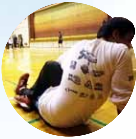
準備運動はしっかり!

部署間の交流を目的に、ソフトバレー大会が開催されました。 今回が第一回目の開催でしたが、各部署から30名を超える参加があり、 8チームにわかれて全員が健康的な汗を流しました。