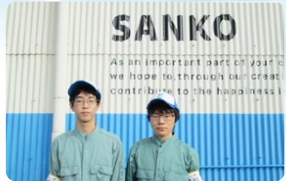
米子高専生、島根大学生2名の学生が 同時期に職場体験です！

また、工場長クラスから新入社員と年代を問わず一緒に仕事をして頂き学校ではなかなか接する機会のない年齢層の社員との会話もしていただきました。殆どが立ち仕事で大変だったと思いますが、二人で協力しながら楽しく体験していただくことができました。