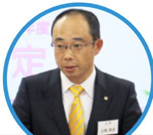
社長より、内定者の皆様に『贈る言葉』をお話されました。