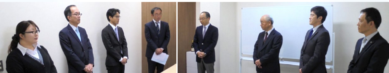
■4月11日開設式の様子

この度、三光並びグループ会社(三光エネルギーサービス、エイチテック)は新たに東京本部(東京都中央区京橋)を開設致しました。現在、当社が進める低濃度PCB処理を始め、エイチテックの地質調査や汚染度処理、三光エネルギーサービスの石油卸販売等の営業活動拠点として全国的に活動してまいります。みなさまにおかれましては引き続きご愛顧の程よろしくごお願い申し上げます。また、近くにお寄りの際は是非お越しく下さい。スタッフ一同お待ちしております。