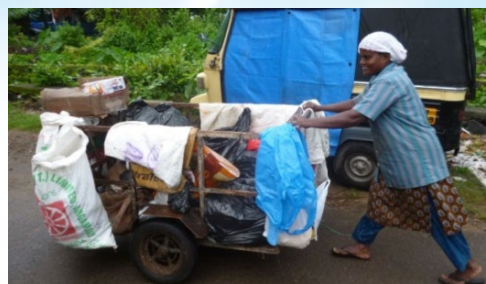
生ごみとそれ以外を分別回収