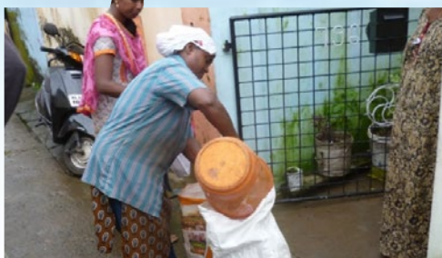
戸別回収状況を見学