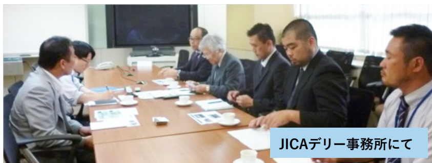
JICAデリー事務所にて

* 9月に公告予定の普及実証事業への応募に向け、関係機関との折衝、候補地の視察など、有意義な調査訪印となりました。採択（結果発表は来年1月ごろ予定）されるよう、最終調整をおこなっていきます。