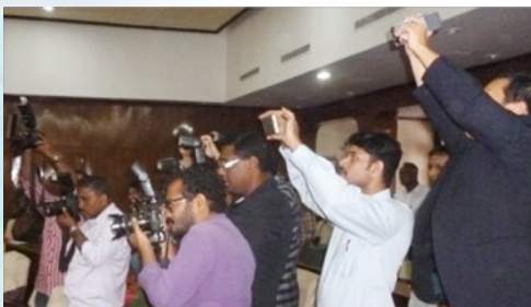
報道陣: 地元TV局2社、新聞社4社