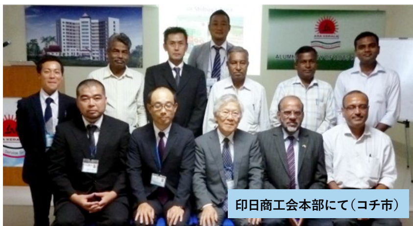
印日商工会本部にて(コチ市)