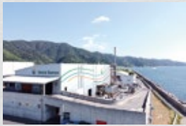
ウェストバイオマス工場