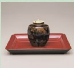
重要文化財 <唐物肩衝茶入 銘 油屋> 島山記念館蔵