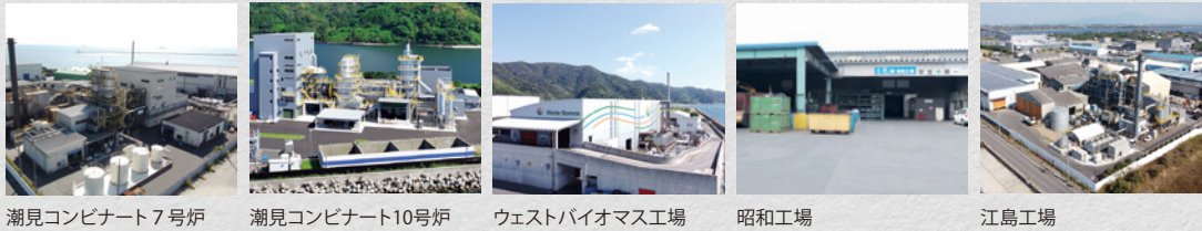
潮見コンビナート7号炉 潮見コンビナート10号炉 ウェストバイオマス工場 昭和工場 江島工場

※ 環境大臣認定 ※ 詳細な許可情報について、三光webページの「情報開示」に掲載しております。